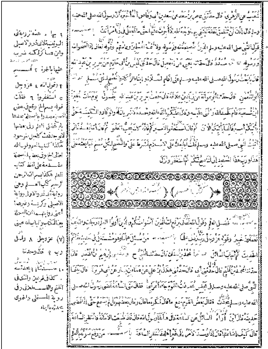
Kedetailan al-Yununi dalam membuat perbandingan antara nuskah-nuskah Sahih al-Bukhari dapat dilihat dalam contoh petikan di atas.